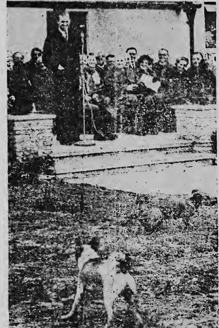
De officiële opening van een sportpark in Chester werd enige ogenblikken vertraagd, toen juist op het moment dat de Hertog van Edinburgh zijn rede zou beginnen twee honden de algemene aandacht trokken. Het sportpark zal morgen voor het eerst worden gebruikt voor kinderspelen en het draagt daarom de naam Kroningspark.

in het WILHELMINASTADION Koop VANDAAG nog een kaart in de voorverkoop en komt onze jongens aanmoedigen